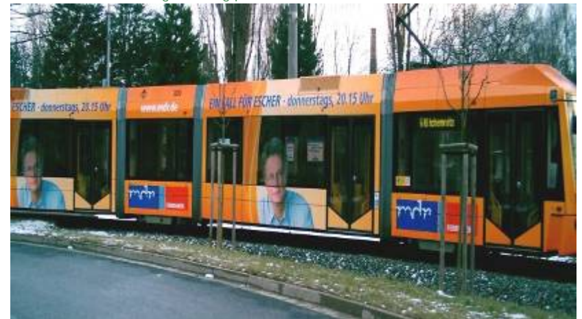
Straßenbahn – Ganzgestaltung plus

Jede Variobahn ist täglich 200 km mit Ihrer Werbung unterwegs und quert dabei ca. 30 mal die Chemnitzer Innenstadt