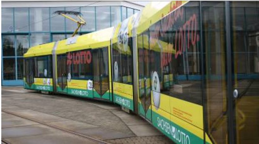
Straßenbahn – Ganzgestaltung plus

Jede Variobahn ist täglich 200 km mit Ihrer Werbung unterwegs und quert dabei ca. 30 mal die Chemnitzer Innenstadt