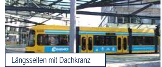
Längsseiten mit Dachkranz