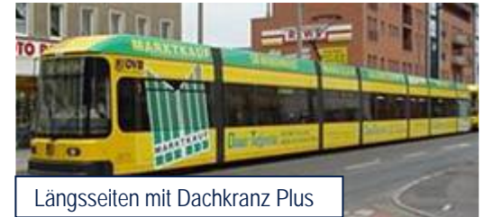
Längsseiten mit Dachkranz Plus